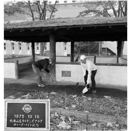
1975. 10. 18. 秋田山王ライオンズクラブ チャーターナイト記念