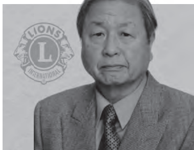
大館北ライオンズクラブ