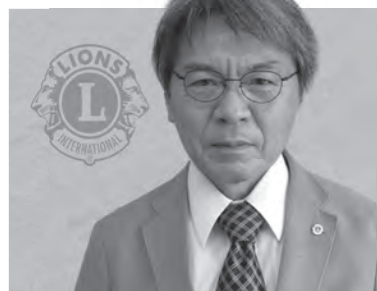
比内ライオンズクラブ