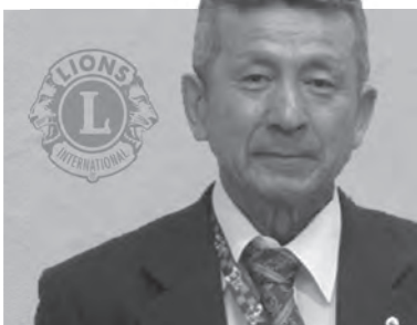
比内ライオンズクラブ