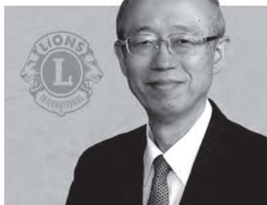
比内ライオンズクラブ