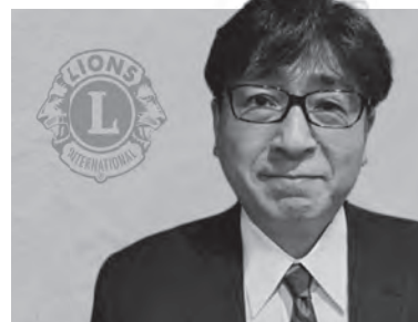
秋田矢留ライオンズクラブ