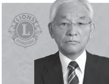
秋田中央ライオンズクラブ