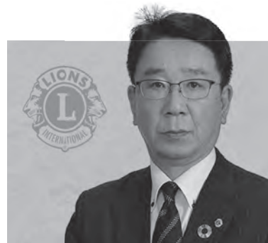
大館ライオンズクラブ