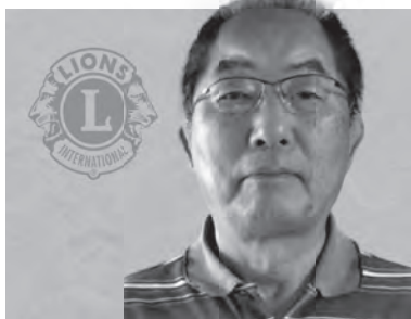
大森ライオンズクラブ