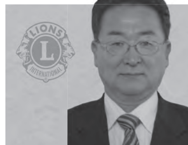
比内ライオンズクラブ