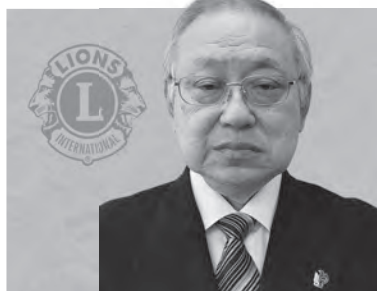
能代ライオンズクラブ