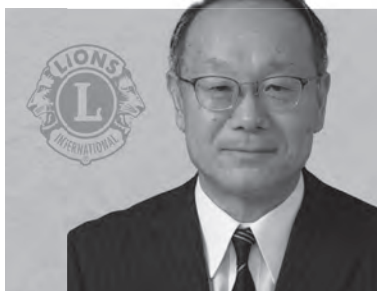
太田秋田ライオンズクラブ