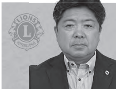
大館ライオンズクラブ