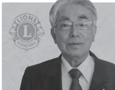
中仙ライオンズクラブ