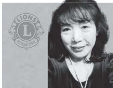
十文字ライオンズクラブ