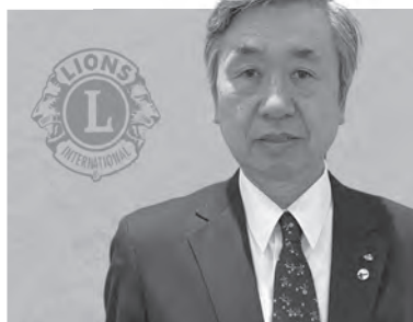
能代ライオンズクラブ