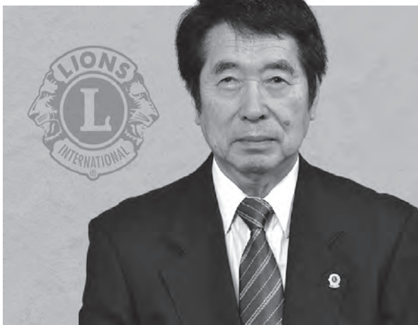
秋田ライオンズクラブ