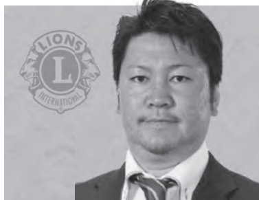
横手かまくらライオンズクラブ