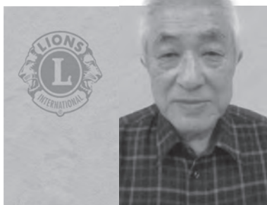
男鹿ライオンズクラブ