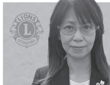
大館ライオンズクラブ