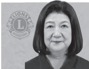
ゆり本荘ライオンズクラブ