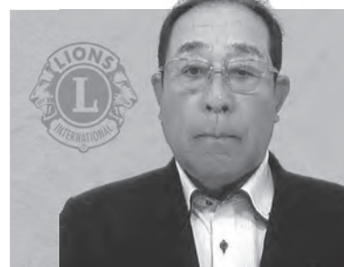
男鹿ライオンズクラブ