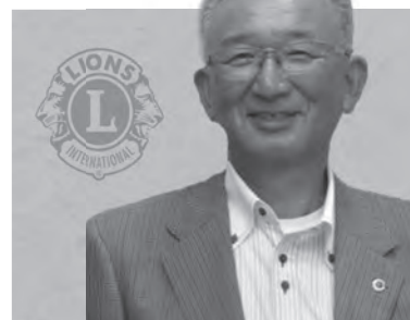
比内ライオンズクラブ