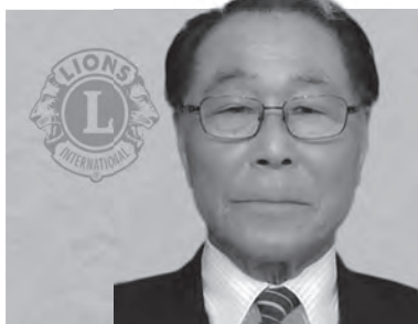
鷹巣ライオンズクラブ